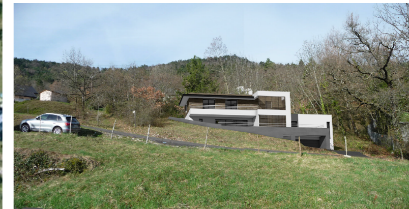
Modifications du permis de construire PCMI6 - Insertion paysagère