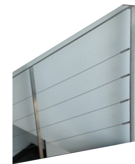
Principe garde-corps intérieur