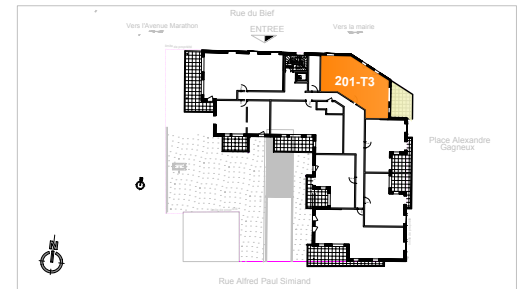
PLAN DE VENTE